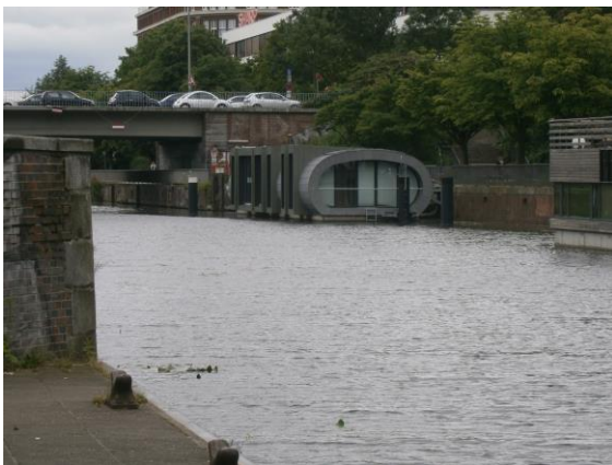
Wasserhäuser am Mittelkanal unterhalb der S- Bahnstation Hammerbrook.

Besonderheit : Tidefreies Gewässer, abwechslungsreich durch teilweise alte Gewerbebauten - Kultur, der Moderne, wie den „Berliner Bogen“, altes und neues Wohnen auf dem Wasser und die an den Kanälen entstandene Flora und Fauna, so dass man sich leicht in den Spreewald versetzt fühlt.