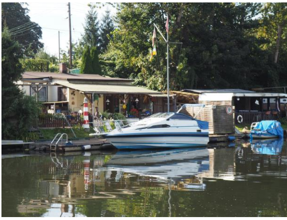
Idyll an der Bille.