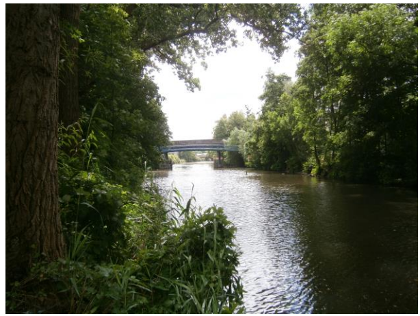
Auf der Bille.