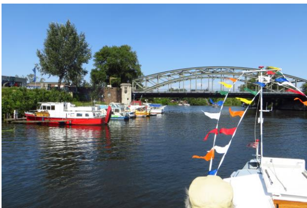
Wasserkreuz Bille- Tiefstack- Kanal.