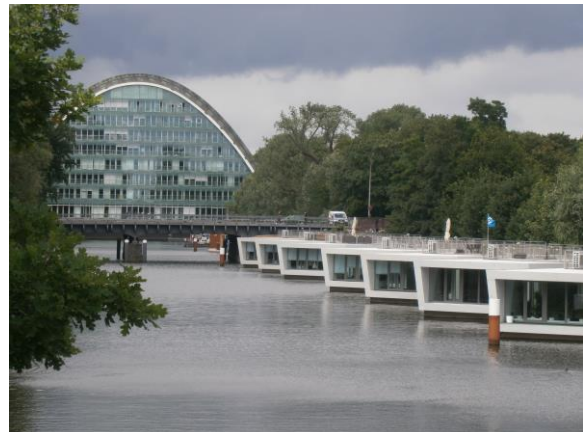
Wasserhäuser beim „Berliner Bogen“.