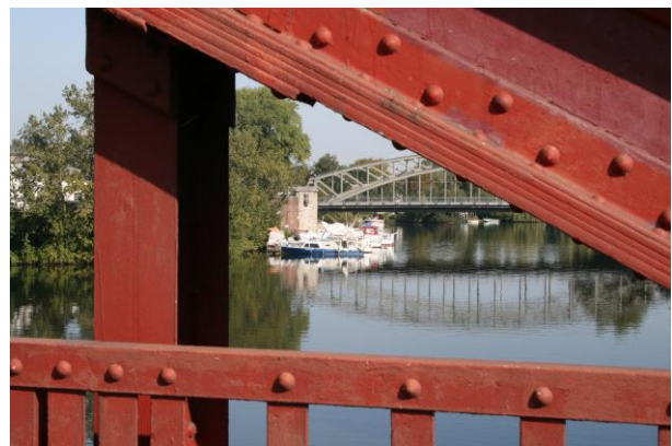
Blick auf den Tiefstack- Kanal.